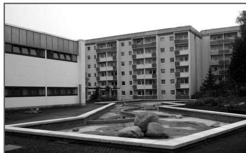
Kunstbrunnen an der Sachsenhalle

Um in Zukunft die Betriebskosten der Anlage nachhaltig zu senken, wird auf dem Vordach der angrenzenden Sachsenhalle eine Photovoltaikanlage installiert. Die vom solaris Unternehmensverbund gesponserte Anlage ist mit einer Leistung von rund 2 kW ausgestattet. Der aus der Sonnenenergie gewonnene elektrische Strom wird direkt ins Stromnetz eingespeist. Die damit verbundene Einspeisevergütung trägt maßgeblich zur Reduzierung der Betriebskosten der Brunnenanlage bei.